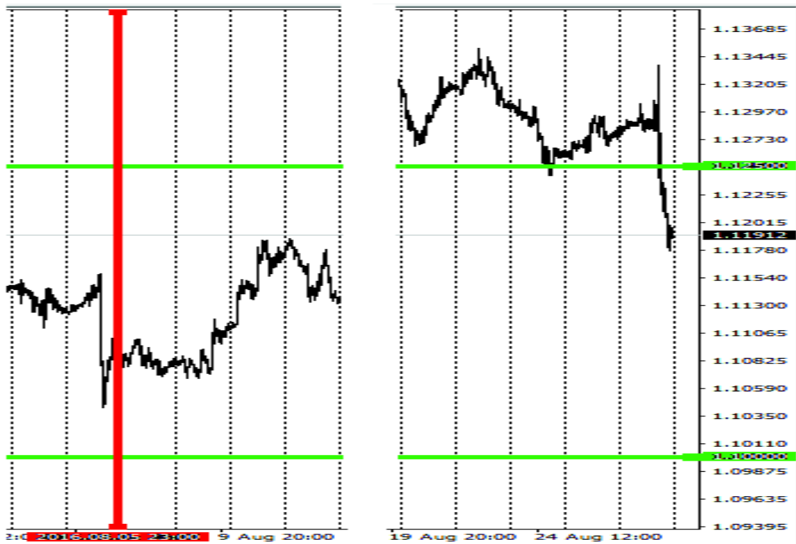
Рис. 3. Линия начала опционного месяца, линии границ рынка

Значения текущей цены фьючерса по данным отчета CME Group и текущей цены финансового инструмента EUR/USD на Форекс могут отличаться на несколько пунктов (Forward points), обычно это значение составляет для EUR/USD 1.5-2 пункта, поэтому данным расхождением можно пренебречь.